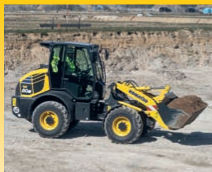
Elektronisch gesteuerter Laststabilisator (ECSS) (optional)