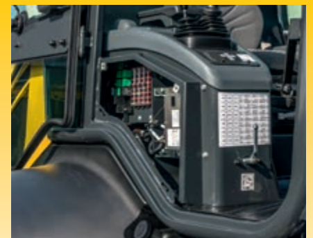
Seitliche Wartungsklappe für schnellen Wartungszugang