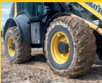
100% Differentialsperre, vorn und hinten (optional)