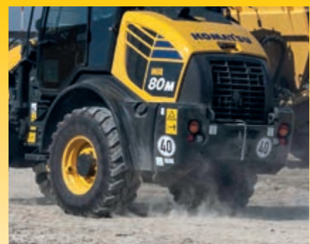
Schnellläuferversion mit 40 km/h hydrostatischem Antrieb (optional)