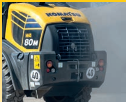
Grobmaschiger Kühler mit automatischem Umkehrlüfter (optional)