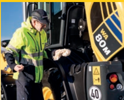
Schneller, einfacher und bequemer Zugang zu allen täglich zu wartenden Punkten