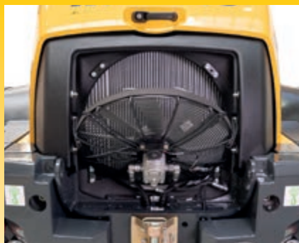
Kippbarer Kühlerlüfter für bequeme Reinigung