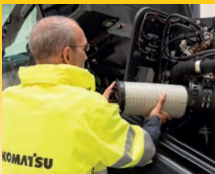
Schneller, einfacher und bequemer Zugang zu allen täglich zu wartenden Punkten