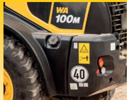
Schnellläuferversion mit 40 km/h hydrostatischem Antrieb (optional)