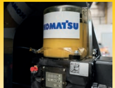
Die Zentralschmieranlage ab Werk reduziert die täglich anfallenden Wartungsarbeiten auf ein absolutes Minimum (optional).