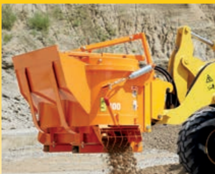
High-Flow-Version mit max. 120 l/min bei 210 bar (optional)