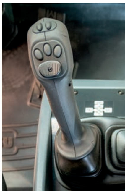
PPC-Multifunktionshebel mit optionaler elektronischer Vorsteuerung (EPC) für 3. und 4. Hydraulikfunktion