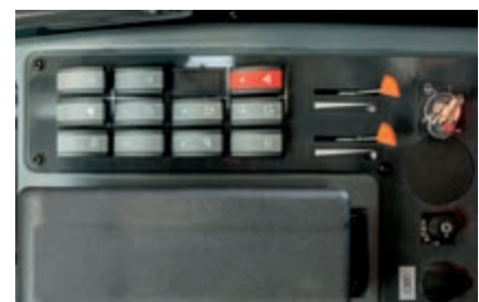
Optimierte, ergonomische Bedienelemente