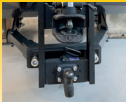
Höhenverstellbare Kugelkopf- und Automatikkupplungen (optional)